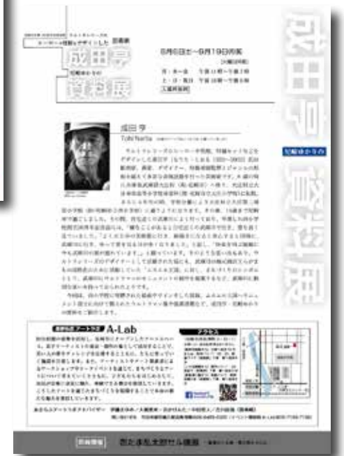
成田亨資料展 フライヤー