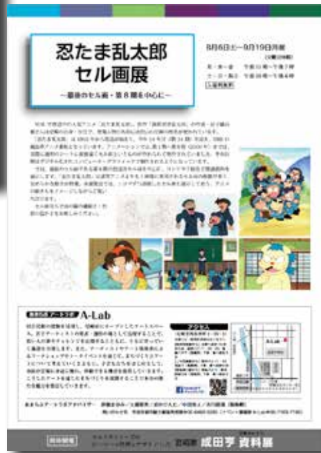
忍たま乱太郎セル画展 フライヤー